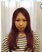
無造作でドライな質感のロングウェーブが、媚びない「キレイ」を演出。髪色は太陽に映える「サンシャインカラー」。