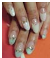
2種類のデザイン×120色のカラーからチョイス!